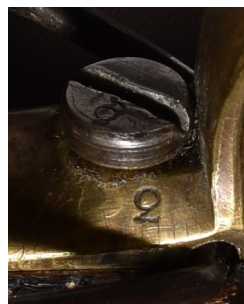
Märkt på varbygel