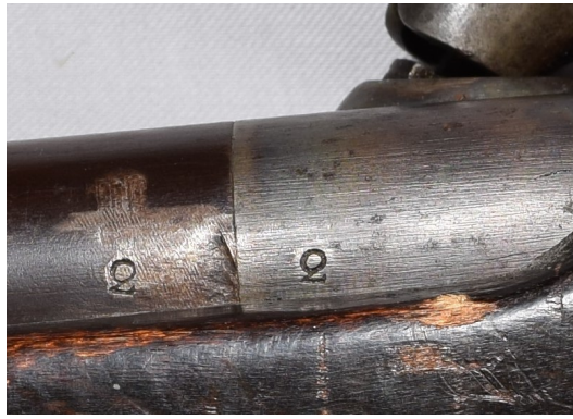
Märkt på pipan och svansskruven