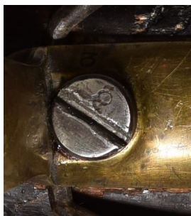
Märkt på skruven som går genom varbygel som håller fast svansskruven