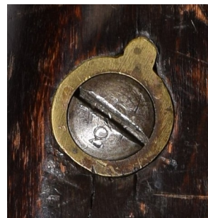
Märkt på skruvskallen till låsskruven som går genom sidblecket (vänster sida) och håller fast låset (höger sida)

Sammanlagt är geväret märkt med 13 stycken 2:or