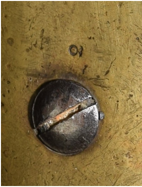
Märkt på bakplåten