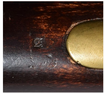
Märkt i kolven bakom varbygeln